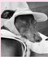
作業中の熱中症に注意するワン!!

※2回目の防除は傾穂期に入るため、散布には充分気を配りますが、倒伏の恐れがありますので、予めご了承願います。